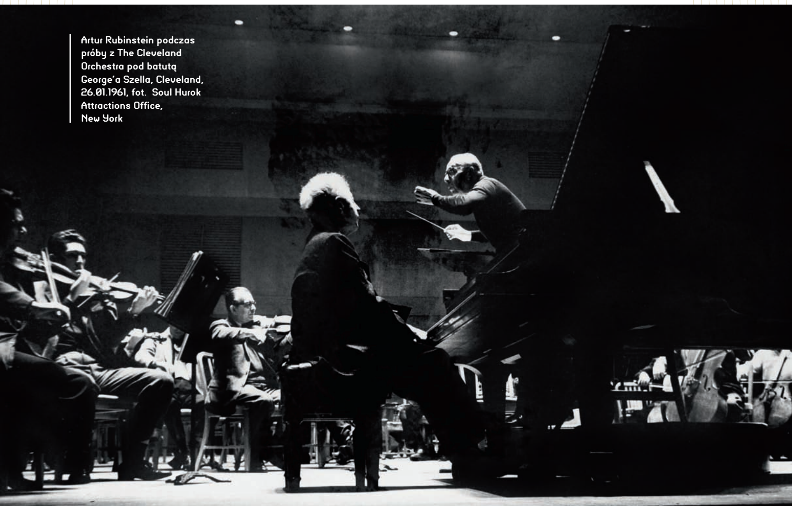
Artur Rubinstein podczas próby z The Cleveland Orchestra pod batutą George'a Szella, Cleveland, 26.01.1961

Wielką serdecznością, jaką nas obdarzono, była forma rewanżu i podziękowania za gościnę w czasie ich koncertów w Warszawie 27 maja oraz 12 i 13 czerwca w 1957 roku.